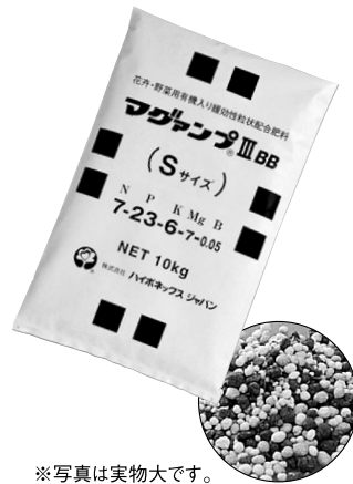
※写真は実物大です。