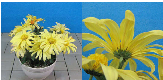
・処理区: 処理から約1ヵ月が経過したが、アブラムシの増殖なし