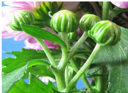
・処理3日後(死核除去)