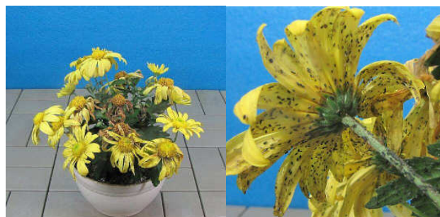
・未処理区: 花卉、茎、葉至る所にアブラムシが大量繁殖