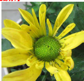
・4日後 アブラムシの活動を確認