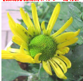
・処理前 アブラムシの活動を確認